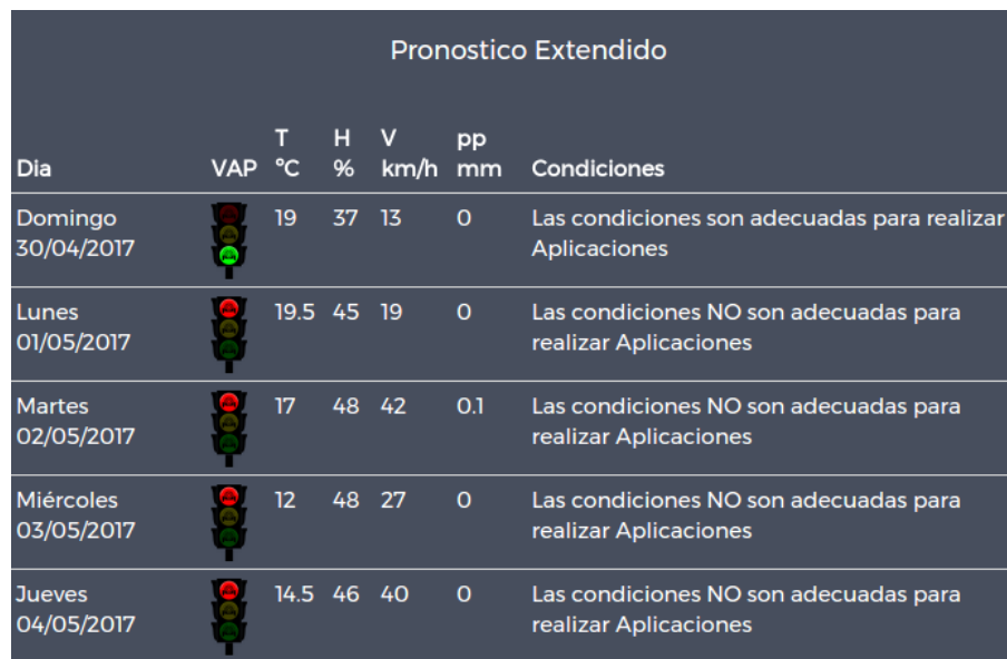
Figura 5. Prototipo de aplicación del semáforo con el pronóstico del los próximos días.