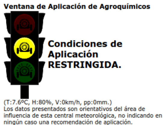
Figura 1. Aplicación web embebida dentro del sitio oficial del INTA.

Río Negro, en el marco de la carrera Especialización en Management Tecnológico de la Universidad Nacional de Río Negro sede Alto Valle y la participación en un proyecto destinado al desarrollo de una aplicación web para la gestión de los cuadernos de campos de fruticultura financiado por el SENASA, con la participación del INTA y de las Facultades de Ciencias Agrarias e Informática de la Universidad Nacional del Comahue [5]. Como resultado se desarrolló un sistema Web denominado Semáforo de Aplicación de Agroquímicos[6] que se diagramó con el diseño que muestra la Figura 1.