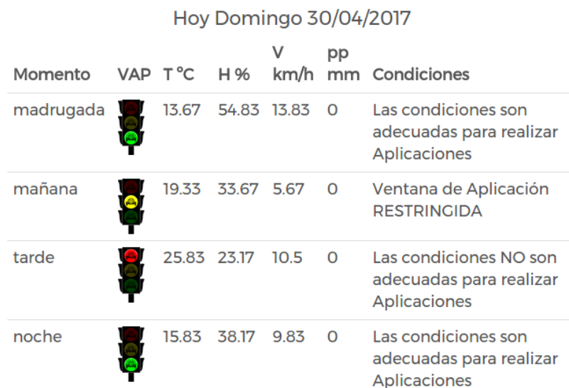
Figura 4. Prototipo de aplicación del semáforo con el pronóstico del día.

Para realizar la selección del proveedor de pronósticos, se ha hecho un registro diario de tres proveedores del valle de Río Negro y Neuquén sobre la zona donde se encuentra la estación meteorológica, para analizar estadísticamente si la información que proveen se aproxima a los valores reales. El proveedor seleccionado tiene una API REST en formato XML con la información de los pronósticos de las variables temperatura, humedad, viento y lluvia, de cada hora de los próximos cinco días.