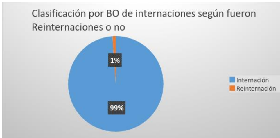
Gráfico5. Clasificación por BO de las internaciones con diagnóstico no válidos según fueron reinternaciones o no