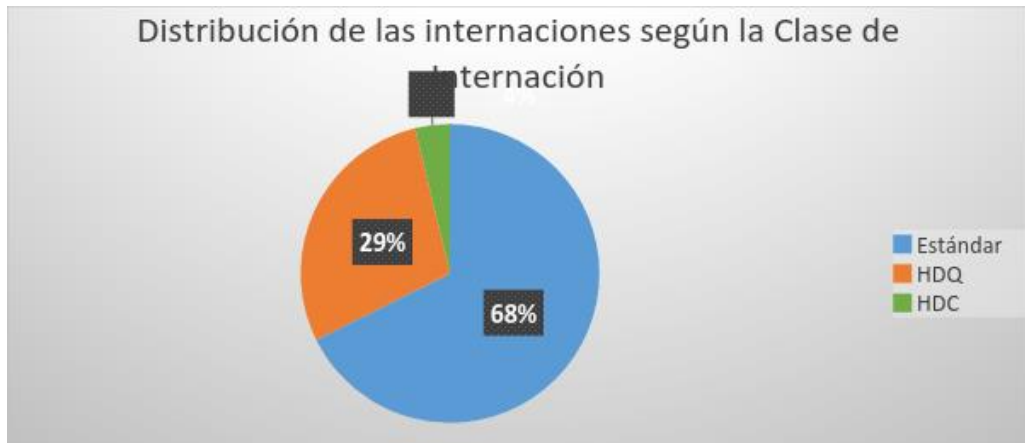
Gráfico 2. Distribución de las internaciones con diagnóstico principal no válido según la clase de internación.

Las internaciones pueden ser clasificadas en: