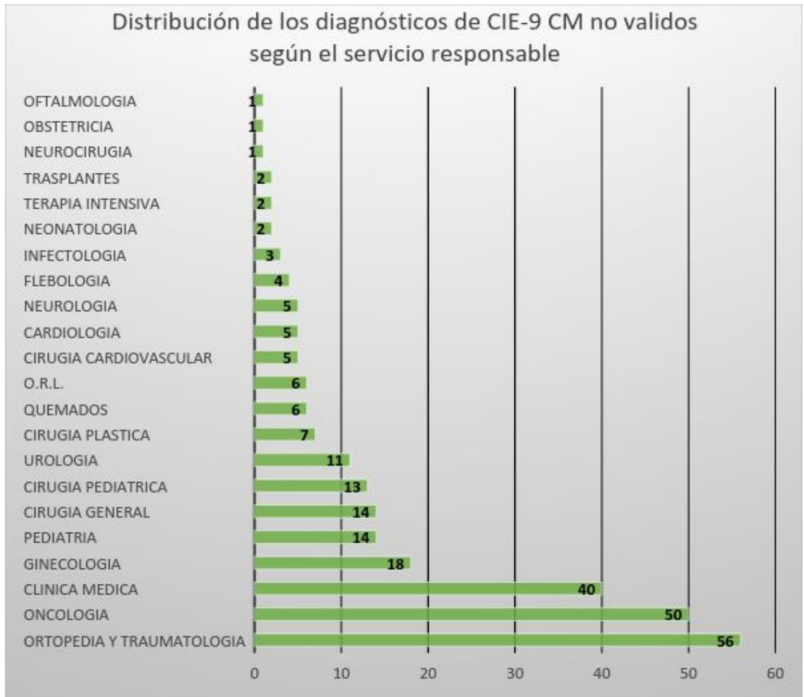
Gráfico 1. Distribución de los diagnósticos principales con códigos no válidos según servicio responsable.

De acuerdo a la revisión llevada a cabo mediante la herramienta de BO, se determinó que de las 41154 internaciones auditadas durante el periodo de estudio, y sólo teniendo en cuenta las 266 internaciones cuyos diagnósticos principales estaban mal codificados, o sea el código era no válido, el 68% de las mismas correspondían a internaciones estándar (180 internaciones), 28% a HDQ (76 internaciones) y un 4% a HDC (10 internaciones) según lo indica el Gráfico 2.