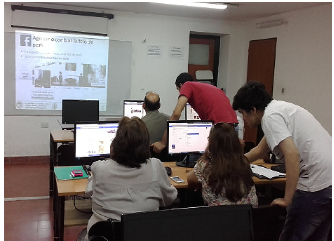
Figura 3. Estudiantes voluntarios ayudando a los alumnos del taller.